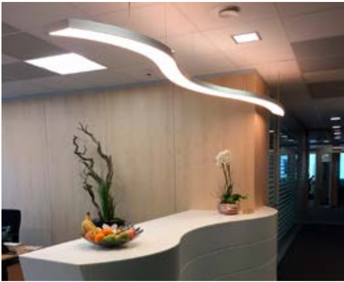
Structures aluminium rétro-éclairées - Luminaire Suisse - Réalisation : Linsi-tech

La compatibilité des LED avec nos toiles vous offre une personnalisation totale : un revêtement imprimé avec l'image de votre choix ou une création d'artiste créeront une atmosphère unique.