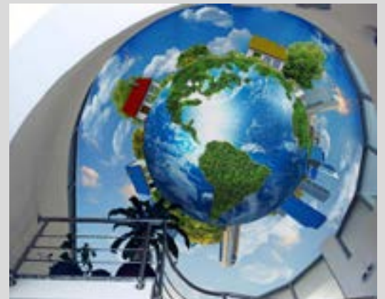
Plafond trompe l'oeil rétroéclairé - Allemagne Réalisation : Baumann

Certains espaces publics sont désormais pensés pour que l'acoustique soit la plus agréable possible, centres commerciaux dans lesquels le bruit omniprésent doit être atténué, ou cabinets médicaux où la discrétion est nécessaire.