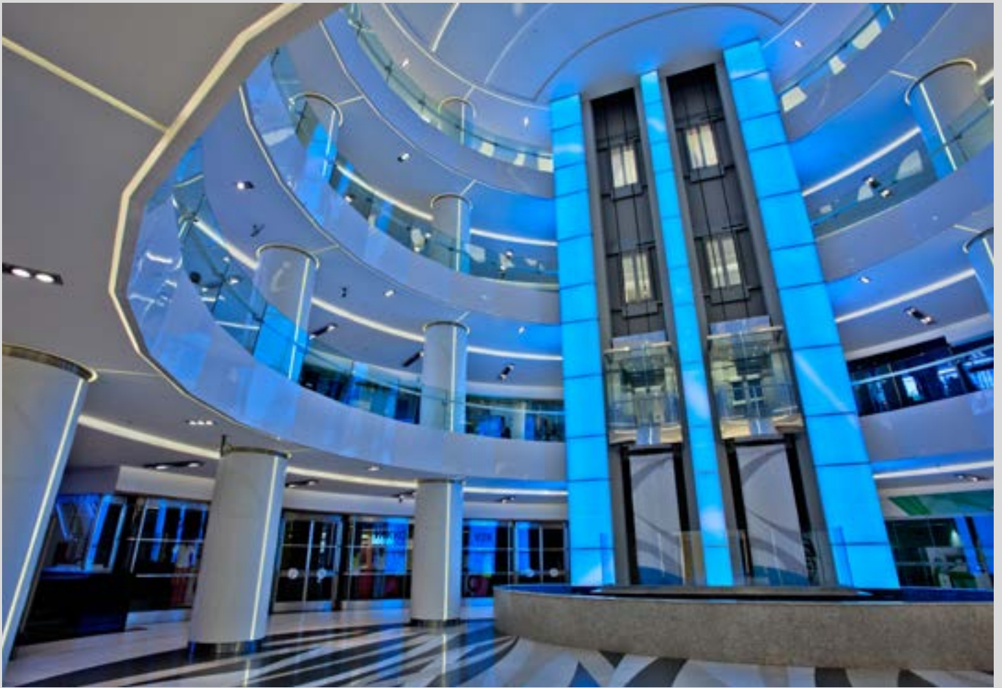
Centre commercial Akmerkez - Turquie - Revêtement rétroéclairé - Architecte : Filiz Yilmaz - Réalisation : TTI Elektrik Elektronik