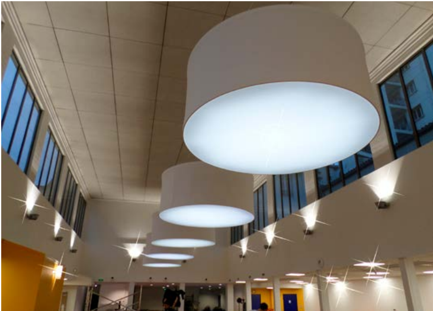
Centre commercial - Luminaires XXL en structures aluminium - Toiles rétroéclairées - France - Réalisation : SPIDER DESIGN

La lumière nous est nécessaire, vitale même : elle régule notre organisme et notre humeur.