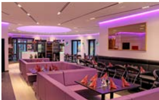
Restaurant - Plafond acoustique avec intégration de chemins lumineux et rétroéclairage - Danemark Réalisation : RALBO

De l'intégration de spots dans un plafond tendu à un cadre imprimé, en passant par une toile translucide rétroéclairée avec des LED, la gamme SO LIGHT vous permet d'imaginer votre propre scénographie.