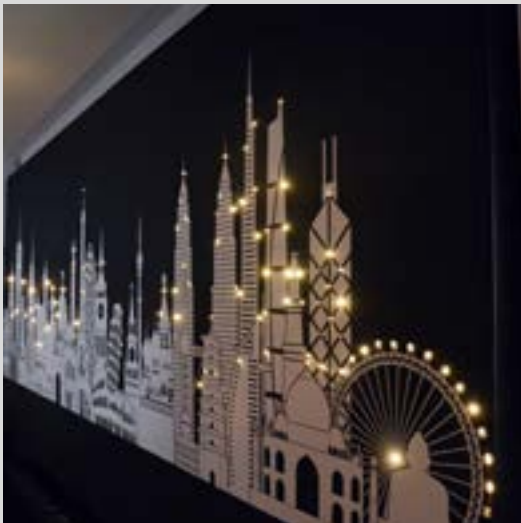
Mur imprimé avec fibre optique intégrée - France - Réalisation : CLIPSO PRODUCTION

Embarquez dans les étoiles avec les fibres optiques intégrées dans nos toiles ! Aux murs ou aux plafonds vous créez ainsi une ambiance unique qui fait rêver.