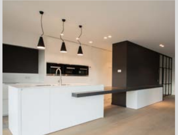
Résidentiel - Plafond acoustique avec intégration de luminaires spots - Belgique - Réalisation : MONAVISIA

Mettez en valeurs vos produits dans vos magasins et showrooms avec un rendu lumineux moderne et immaculé.