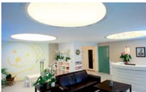
Clinique Dentaire - Plafond avec cercles rétroéclairés

La lumière nous est nécessaire, vitale même : elle régule notre organisme et notre humeur.