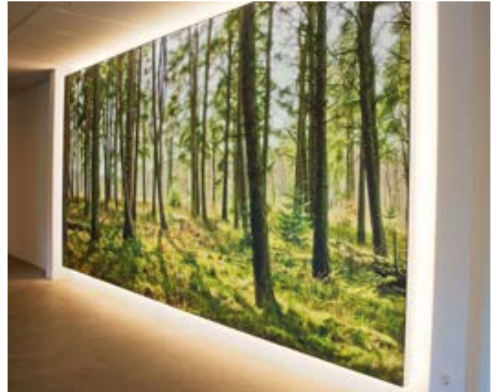
Caisson mural - Belgique - Revêtement imprimé rétroéclairé Réalisation : City Outdoor

Nos ateliers sauront créer le luminaire dont vous avez besoin, nous concevrons pour vous la forme la mieux adaptée et vous proposerons diverses intensités lumineuses. Cette forme sera moderne, élégante, esthétique ou épurée... Conforme à vos envies !