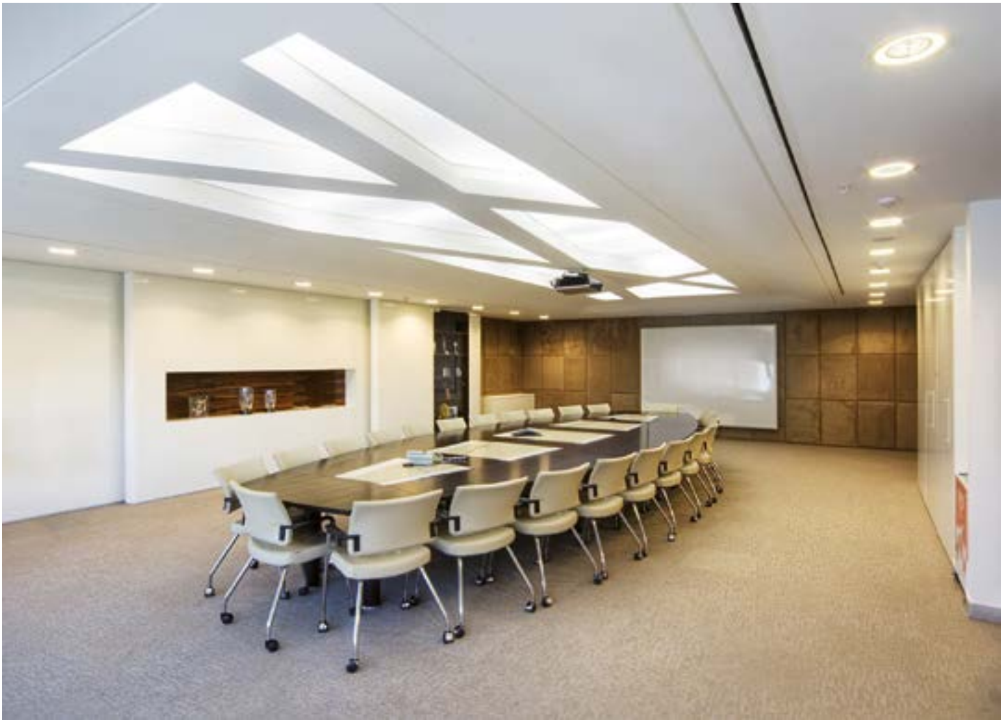
Salle de réunion UNILEVER - Plafond avec structure rétroéclairée