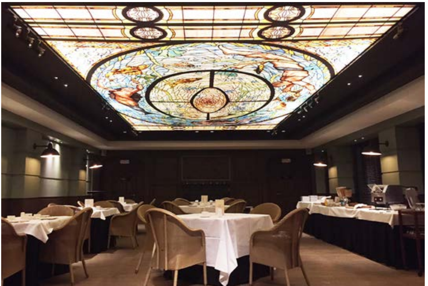
Restaurant - Belgique - Plafond imprimé rétroéclairé - Réalisation : MONAVISA