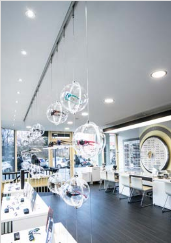
Magasin d'optique - Intégration de spots et caissons rétroéclairés - Allemagne - Réalisation : Optimaler

Embellissez tout votre espace avec un effet lumineux qui simule la lumière du jour.