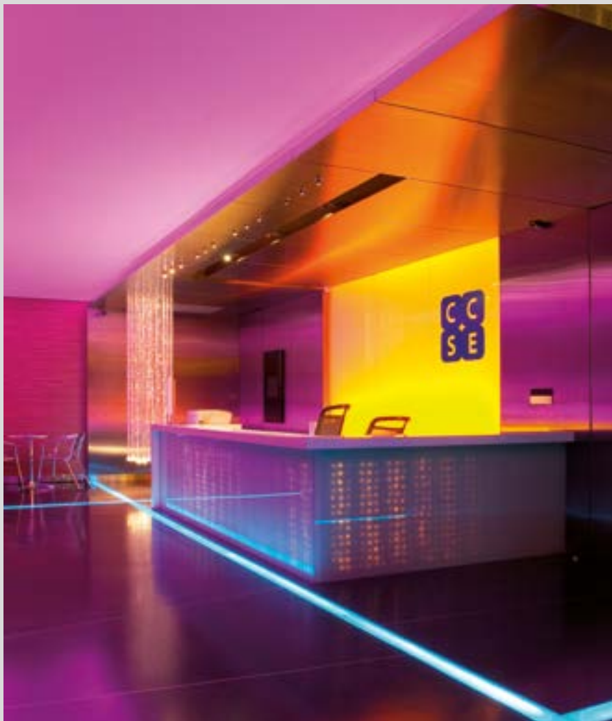
Bureaux - Thaïlande - Revêtements rétroéclairés RGB - Réalisation : CCSE